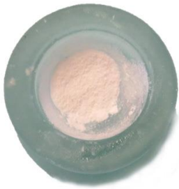
Fig. 3. Pasta triantibiótica