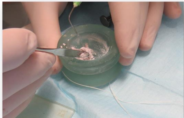
Fig. 4 Pasta triantibiótica con solución fisiológica lista para llevar al conducto

En una segunda cita, pasados los 30 días, el paciente volvió asintomático. Se colocó anestesia sin vasoconstrictor (Indican, Lidocaína Clorhidrato 2 %) y se realizó nuevamente aislamiento con goma dique; se eliminó el ionómero vítreo y se lavó con solución fisiológica. Con una lima H (H-file Dentsplay Maillefer) y teniendo en cuenta la longitud de trabajo, se llevó dicha lima hasta llegar a la zona del tejido periapical para ocasionar un sangrado y así poder formar un coágulo dentro del conducto. A continuación se colocaron 4 mm de Trióxido Mineral Agregado (MTA,