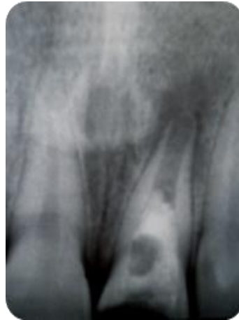
Fig. 5 Rx en donde se observa Colocación de MTA y sellado con Ionómero Vítreo

Tulsa Dental Dentsplay, Tulsa, OK) dentro del canal y se selló con ionómero vítreo (Riva selfcure, Made in Australia (Fig. 5).