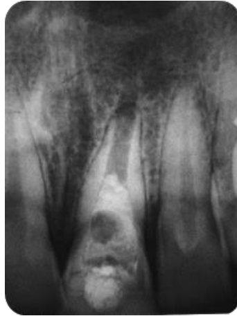
Fig. 7 Control radiográfico, once meses luego del tratamiento

A los 11 meses el paciente fue nuevamente recitado, se le realizaron pruebas de sensibilidad las cuales dieron respuesta negativa y radiográficamente se observó curación casi total de la lesión apical (Fig. 7).