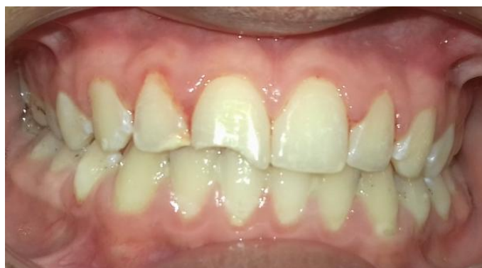
Fig. 17-Retiro de férula.

A los 30 días de producido el traumatismo se recitó al paciente el cual no refirió sintomatología dolorosa y su evolución fue favorable, no presentó movilidad. Se tomaron pruebas de sensibilidad al frío y calor en elementos vecinos resultando las mismas positivas. Se retiró la férula, con piedra de diamante troncocónica y fresa multifilos, pulido con tazas de goma y discos (Fig.17). Se realizó restauración definitiva del elemento 11 y 12 con composite (Filtek Z250, 3M ESPE) (Fig.18) y posterior control radiográfico en la cual se evidenció buena evolución sin signos radiográficos de reabsorción radicular (Fig.19).