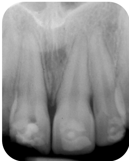
Fig. 13- Radiografía preoperatoria del elemento 11.

Se recitó al paciente a los 10 días, se tomó radiografía pre operatoria, en la cual no se observaron signos de infección ni zonas de reabsorción, se pudo visualizar ensanchamiento del LP en el elemento 11 (Fig.13). Se realizó anestesia (Carticaína Clorhidrato 4% Adrenalina, Anescart Forte) del elemento 11, aislamiento absoluto con goma dique, apertura con fresa redonda N° 3, preparación de acceso con piedra troncocónica, determinación de la longitud de trabajo utilizando localizador apical (Propex Pixi, Dentsply-Maillefer), radiografía conductometría para confirmar la longitud (Fig.14). Instrumentación manual con limas K de acero (Maillefer), irrigación con 20 ml de solución de hipoclorito de sodio concentración 5,25% (Tedequim, Industria Argentina), se secó el conducto con conos de papel (Dentsply) se adaptó cono maestro de gutapercha (META BIOMED) N° 50 taper 02, se realizó radiografía conometría (Fig.15). La obturación fue mediante técnica de condensación lateral con conos accesorios de gutapercha (META BIOMED) y cemento sellador de Grossman (Farmadental). Se selló con Ionómero Vítreo (Ketac Molar, 3M ESPE). Se tomó radiografía final (Fig.16).