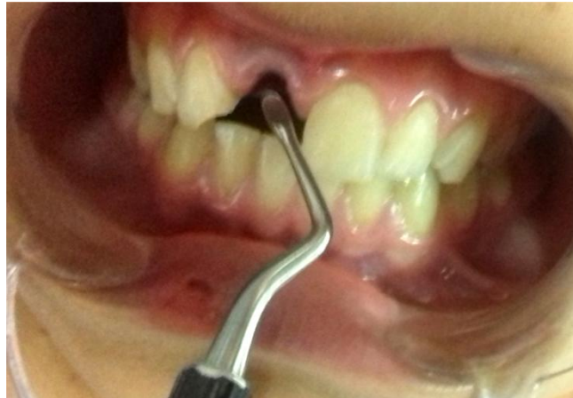
Fig. 6- Limpieza del alveolo con cureta ósea.

Se continuó con la limpieza del alveolo, se retiró con cureta para hueso el coagulo de sangre que ya había comenzado a formarse (Fig.6) y se realizaron lavajes con Solución fisiológica estéril (Solución fisiológica Droguería Casanova).