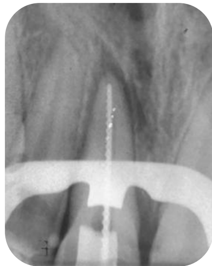
Fig. 14- Radiografía conductometría del elemento 11.