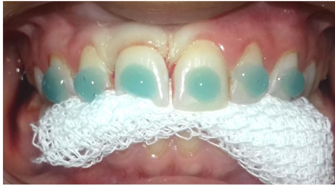
Fig. 8- Grabado ácido de los elementos a ferulizar.