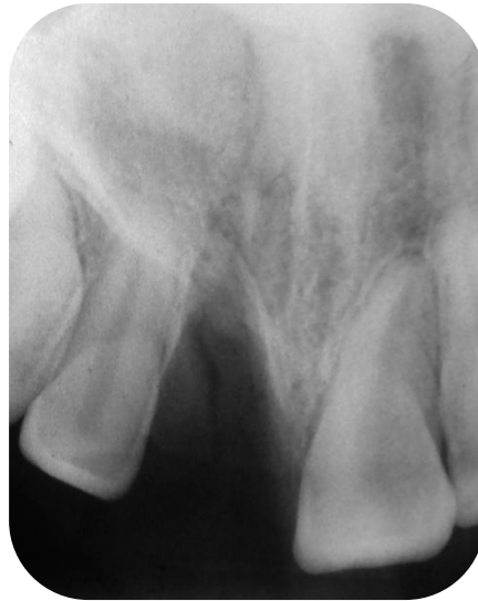
Fig. 3- Radiografía periapical. Se observa avulsión del elemento 11 y fractura coronaria del elemento 12.

Se realizaron pruebas de sensibilidad al frío (Endofrost ROEKO) y calor en elementos 12, 21 y 22, resultando las mismas positivas.