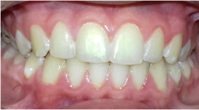
Fig. 22- Control clínico a los 7 meses.

Se realizó nuevo control a los 7 meses de producido el traumatismo, se evidencia evolución clínica (Fig.22) y radiográfica (Fig.23) favorable.