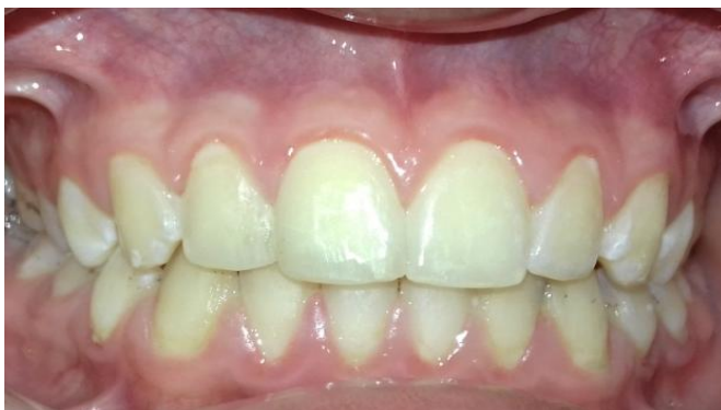
Fig. 20- Control clínico a los 2 meses.

Se realizó control a los 2 meses de producido el traumatismo, no presentó signos clínicos de infección, asintomático a la palpación (Fig.20). La radiografía periapical mostró tejidos en normalidad, disminuyó el ensanchamiento del LP que se observaba anteriormente (Fig.21).