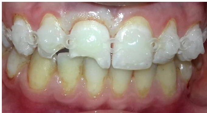
Fig. 10- Férula Lábil.

La férula se extendió desde el elemento 13 al 23. El diente avulsionado es el último en fijar para asegurar su correcta posición (Fig. 10).