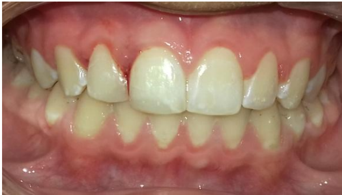
Fig. 18-Restauración definitiva de elementos 11 y 12.