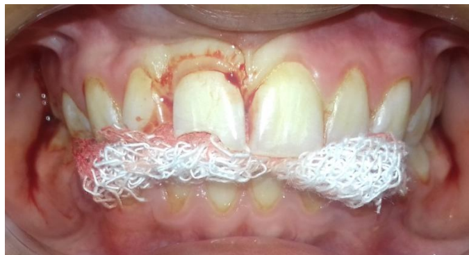
Fig. 7- Reimplante del elemento 11.

Una vez acondicionados los tejidos y el alveolo receptor se procedió a reimplantar el elemento 11 (Fig. 7) con movimientos suaves.