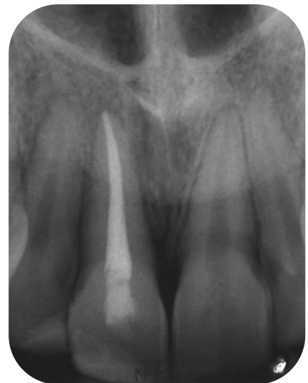
Fig. 21- Control Radiográfico a los 2 meses.