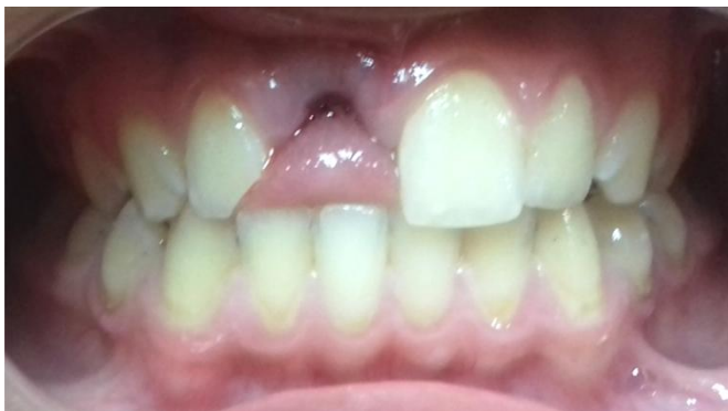
Fig. 1- Examen bucal inicial donde se observa avulsión de elemento 11 y fractura coronaria del elemento 12.

Se constató que el traumatismo ocurrió en la escuela y el elemento 11 fue almacenado durante 3 horas en medio seco luego de producido el accidente (Fig.2).