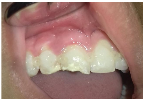
Fig. 12- Protección Indirecta con Ionómero vítreo en elementos 11 y 12.

Se realizó protección indirecta con Ionómero Vítreo (Ketac Molar, 3M ESPE) al elemento 11 y 12 con diagnóstico de fractura coronaria no complicada (Fig.12).