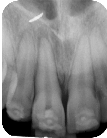
Fig. 11- Radiografía periapical del elemento 11 reimplantado.

Se tomó radiografía periapical para confirmar la correcta reubicación de la pieza en su alveolo (Fig. 11).