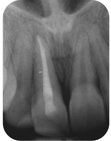
Fig. 23- Control Radiográfico a los 7 meses.