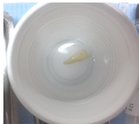
Fig. 5- Lavado del elemento 11 con Solución Fisiológica.