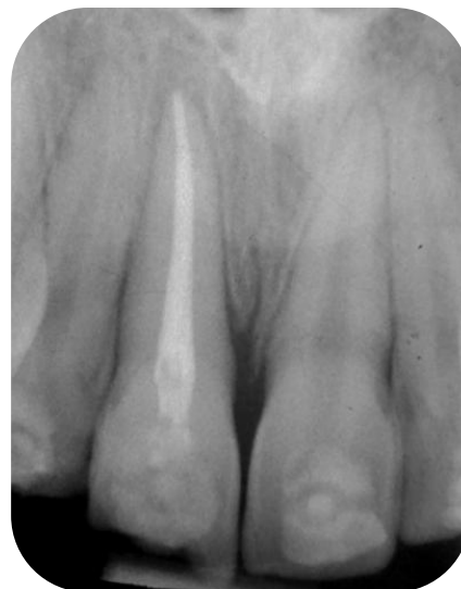
Fig. 16- Radiografía de obturación final del elemento 11.

A los 30 días de producido el traumatismo se recitó al paciente el cual no refirió sintomatología dolorosa y su evolución fue favorable, no presentó movilidad. Se tomaron pruebas de sensibilidad al frío y calor en elementos vecinos resultando las mismas positivas. Se retiró la férula, con piedra de diamante troncocónica y fresa multifilos, pulido con tazas de goma y discos (Fig.17). Se realizó restauración definitiva del elemento 11 y 12 con composite (Filtek Z250, 3M ESPE) (Fig.18) y posterior control radiográfico en la cual se evidenció buena evolución sin signos radiográficos de reabsorción radicular (Fig.19).