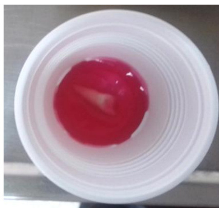
Fig. 4- Colocación del elemento 11 en solución de Fluoruro de Sodio.

Se realizó raspaje de la raíz del elemento 11 con cureta y se colocó el mismo en solución de Fluoruro de Sodio (Klepp Flúor) 1, 23% pH 3,5 durante 5 minutos (Fig.4). Luego fue lavado con Solución fisiológica (Solución fisiológica Droguería Casanova) (Fig. 5).