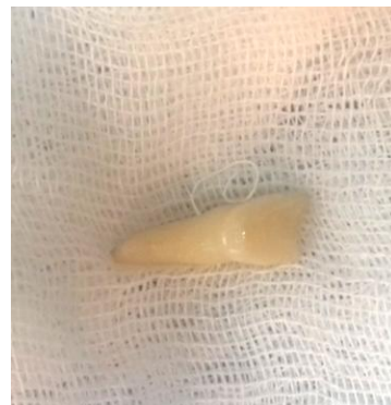
Fig. 2- Elemento 11 almacenado en gasa.

Se realizó radiografía periapical de la zona anterosuperior (Fig.3), en la cual se observó el alveolo vacío correspondiente al elemento 11 y fractura coronaria del elemento 12, descartando otro tipo de lesiones en los elementos vecinos a la zona lesionada.