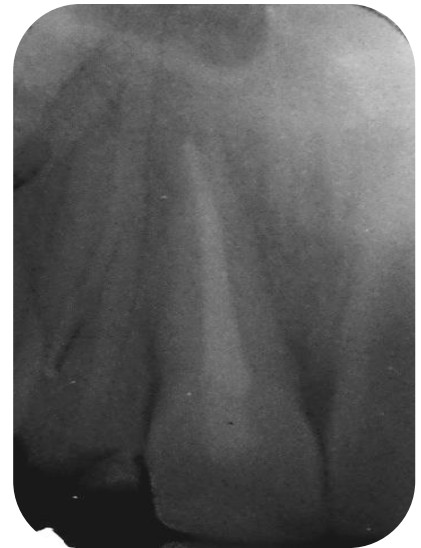
Fig. 19-Radiografía de control a los 30 días.

Se realizó control a los 2 meses de producido el traumatismo, no presentó signos clínicos de infección, asintomático a la palpación (Fig.20). La radiografía periapical mostró tejidos en normalidad, disminuyó el ensanchamiento del LP que se observaba anteriormente (Fig.21).