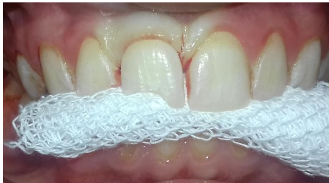
Fig. 9- Técnica adhesiva.

La férula se extendió desde el elemento 13 al 23. El diente avulsionado es el último en fijar para asegurar su correcta posición (Fig. 10).