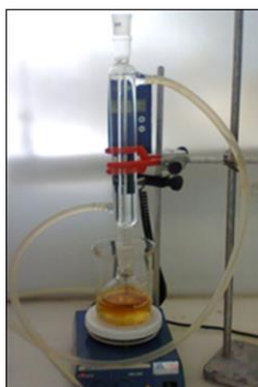
Figura 1. Esquema de la reacción de esterificación del ácido graso.

La reacción de esterificación fue realizada mediante la adición de 10.239 g de ácido graso (ácido dodecanóico) y 1.029 g de lo agente de alquilación dimetilsulfato ((CH 3 ) 2 SO 4 ). Los ensayos experimentales se realizaron a temperatura constante de 65 °C, durante 2 horas con agitación constante y la separación de los componentes se realizó por decantación. Lo aparato experimental usado en la reacción de esterificación se muestra en la Figura 1.