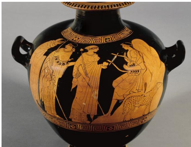
Figura 2 - Hidria ática de figuras rojas, del Pintor del enócoe de Yale, c. 470 a.C.