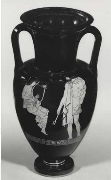
Figura 6- Ánfora nolana ática de figuras rojas, del Pintor de Sabouroff, 460-450 a.C.

576), tocando un instrumento musical mientras los dioses se aproximan a él sin que lo note 6 .