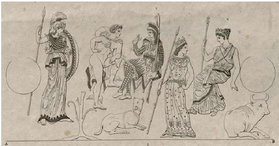
Figura 5- Hidria ática de figuras rojas, del Pintor de Nicias, 420-400 a.C.

También encontramos, por cierto, versiones ridiculizantes de la historia del Juicio. En un esolio al verso 277mo de la Andrómaca de Eurípides, hay una cita de Anticlides de Atenas (siglo 3ro a.C.) rechazando la veracidad de este mito: “se trata de tres lujuriosas mujeres rústicas que se dirigen a una competición de belleza”. Luciano cuenta cómo un banquete ( Symp. § 35) de hombres cultos se transforma en una riña descontrolada a causa de que un tal Hetemocles depositó una carta sobre la mesa que tuvo un efecto comparable al de la manzana de la Discordia en el banquete de los dioses según el narrador. Estas versiones muestran cómo lo habitualmente digno puede convertirse en risible. Anticlides convierte a las diosas en tres campesinas lujuriosas y Luciano muda a los eruditos en unos borrachos pendencieros.