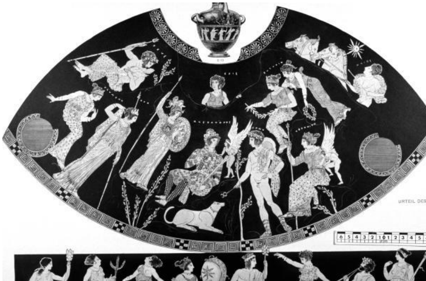
Figura 1- Hidria ática de figuras rojas, vaso nominal del Pintor del Paris de Carlsruhe, c. 400 a.C.

explícita sobre esto. Homero sí nos dice que Paris “ofendió” a las diosas que han sido nombradas unas pocas líneas más arriba ( Il. 24.25s), Hera y Atenea, pero no especifica en qué consistió este ultraje. Agrega que Paris “favoreció” a la diosa que le ofreció la “dolorosa lascivia” y esta es una señal importante. El episodio, aunque oscuro, deja claro que el pastor expresó una preferencia a favor de Afrodita en desmedro de las otras. Pero también deja abierta la especulación: ¿acaso también insultó a las diosas, como sugiere Thomas Stinton (1965: 3 4 )? ¿Acaso Afrodita expresó, como Homero, que la lascivia sería dolorosa? ¿Por qué aceptaría Paris entonces? Y, lo más intrigante, ¿por qué se vio envuelto en una situación en la que tenía que favorecer a una de tres diosas y, al mismo tiempo y posiblemente de forma inevitable, ofender a las otras dos? Reinhardt (1948) demostró hace tiempo cómo la narrativa del Juicio de Paris forma parte integral de la Ilíada y señaló en qué lugares del poema esta narrativa se encuentra replicada. Davies explica (1981) por qué el Juicio de Paris es mencionado y por qué aparece recién en el canto 24to de la Ilíada , indicando que la ira inextinguible de las diosas ofendidas por Paris ha de contrastarse con la sensibilidad de Aquiles, quien depone su ira contra Héctor a causa de Príamo.