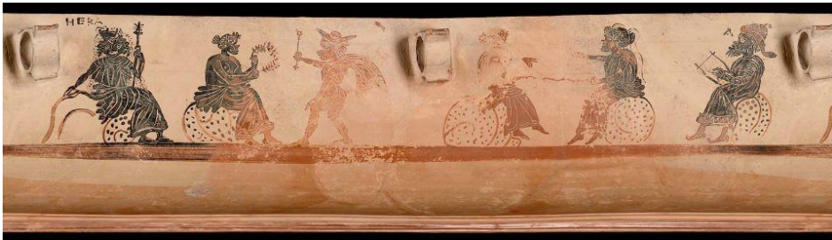
Figura 4 - Skyphos beocio de figuras negras, 420 a.C.

llama aphrosynê y vincula etimológicamente con Afrodita, envuelta en la pasión amorosa. Dion Crisóstomo rechaza que el Juicio haya ocurrido ( 11mo discurso: que Troya no fue destruida § 11-14), puesto que Atenea no devastaría su propia ciudad, Hera no consideraría a su propio marido como incompetente para juzgar su belleza y Afrodita no perjudicaría a su hermana Helena y a su protegido Paris con una decisión cuyas consecuencias conocía de antemano. Él mismo añadirá ( 20mo discurso: de la vida retirada § 19-23) que Paris simplemente imaginó la situación del Juicio como una manera de idear cómo podría conseguir para sí a la más bella de las mujeres y que utilizó esta historia para planificar y llevar a cabo el rapto de Helena. Desde esta perspectiva, Paris aparece más como víctima de la malinterpretación alegórica según Heráclito o como un hábil conspirador según Dion Crisóstomo.