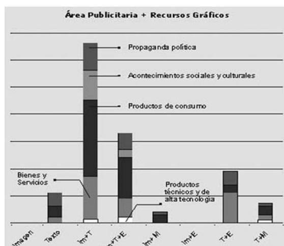
Gráfico 1 Área Publicitaria y Recursos Gráficos. El presente gráfico comprueba la hipótesis de Abraham Moles y Joan Costa.