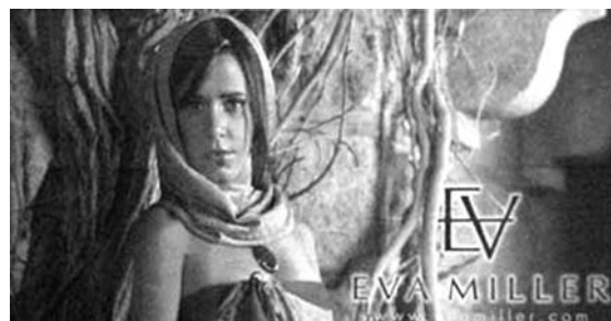
Figura 1 Imagen + Marca. No hay ningún anclaje verbal, la marca (imagen + texto = esquema) ancla la imagen.