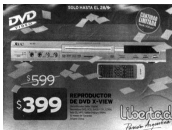
Figura 3 El esquema es un detalle del afiche, apelando a su lógica e inteligibilidad, el mensaje es monosémico sin lugar a dudas.