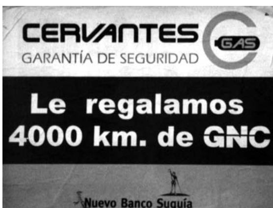
Figura 2 Cuando el texto es el único constructor del mensaje, el poder de atracción e impacto es bajo. Los estímulos que rodean al afiche desvían la mirada del receptor.