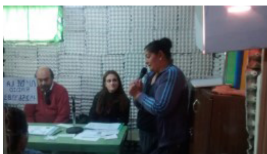
Imágenes de gacetilla y programa semanal de charla radial

Para contestar las dudas de las personas que asistían a la radio y de los oyentes, se repartía en la semana gacetillas con el tema a tratar, también se dejaban buzones para colocar las preguntas, que luego se contestaban al aire durante el programa. Otra forma de contacto fue a través de las líneas telefónicas con mensajes de texto y por Facebook; fue muy estimulante, recibir comentarios que nos manifestaban la necesidad de contar y preguntar sobre los distintos temas que tratábamos. Fue una valiosa experiencia, que nos permitió sentir que dábamos un aporte desde nuestros roles. Destacamos que en el espacio radial siempre fuimos muy bien recibidos y el trato fue excelente