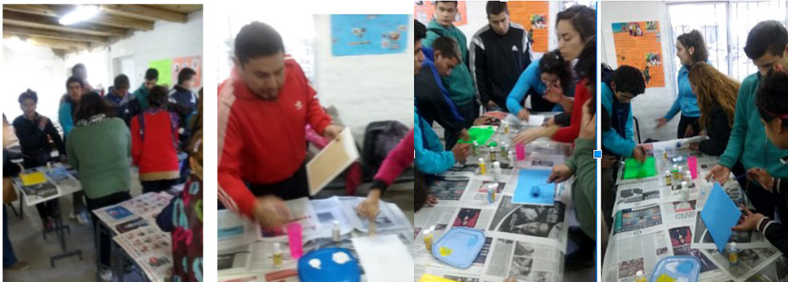
Imágenes de talleres de residuos realizados en CENS 3-415

Los resultados del análisis del terreno indicaron que el vivero y la cocina generaban desechos orgánicos, los cuales eran utilizados para hacer abono orgánico (compost) y el CENS 3-415, producía residuos como papeles, envoltorios de plástico, restos de comida, botellas de plástico. En consecuencia, planteamos la estrategia de la realización de un taller de clasificación de residuos, cuya meta fue concientizar a los alumnos del CENS, de la necesidad de colocar los residuos en un sector puntual, concientizar la importancia de clasificarlos para poder reutilizarlos o darles un destino final. Buscábamos dejar un claro mensaje de que los residuos son materiales que pueden ser útiles, que el manejo de los mismos implica un gasto de dinero, de petróleo y trabajo humano y por esto tiene un gran valor el manejo y organización adecuada. El taller se basó en una breve y concreta charla sobre el valor de los residuos y de cómo clasificarlos. Como resultado del taller se realizaron carteles para la clasificación de residuos, reutilizando los que se podían reciclar y dando destino final a aquellos que no podían reutilizarse.