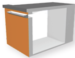
Colección de luz natural diseñado