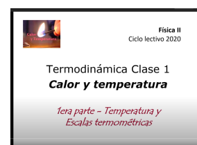
La primera clase de termodinámica