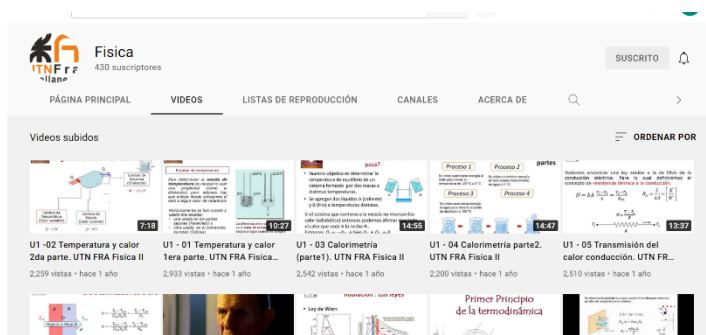
El canal de Youtube donde están alojados más de 40 videos de Física II

Dentro del aula virtual los estudiantes contaban, además, con apuntes de clase en formato PDF. Los videos se transformaron, ya no en un recurso más, sino en uno de los artefactos mediadores que reemplazaron a las "clases teóricas" en las que, en la presencialidad, los estudiantes suelen recibir, pasivamente los desarrollos y explicaciones del docente.