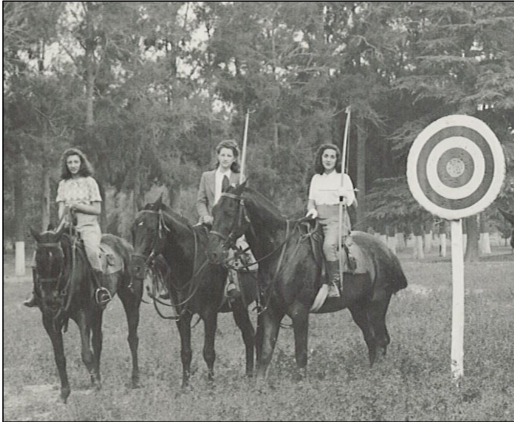
Prácticas deportivas - equitación