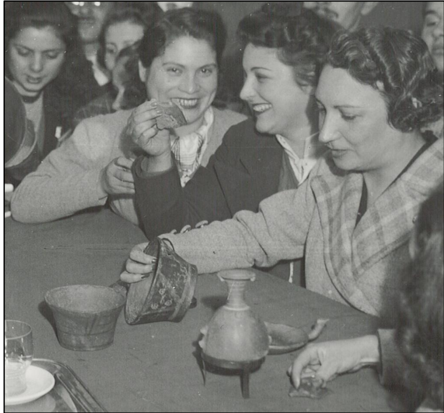
Clase de arqueología