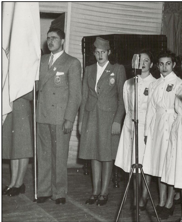
Actos inaugurales U.N.C