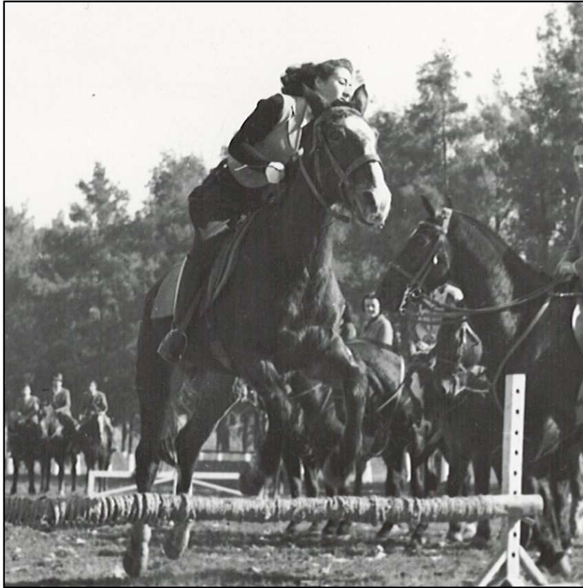
Prácticas deportivas – equitación