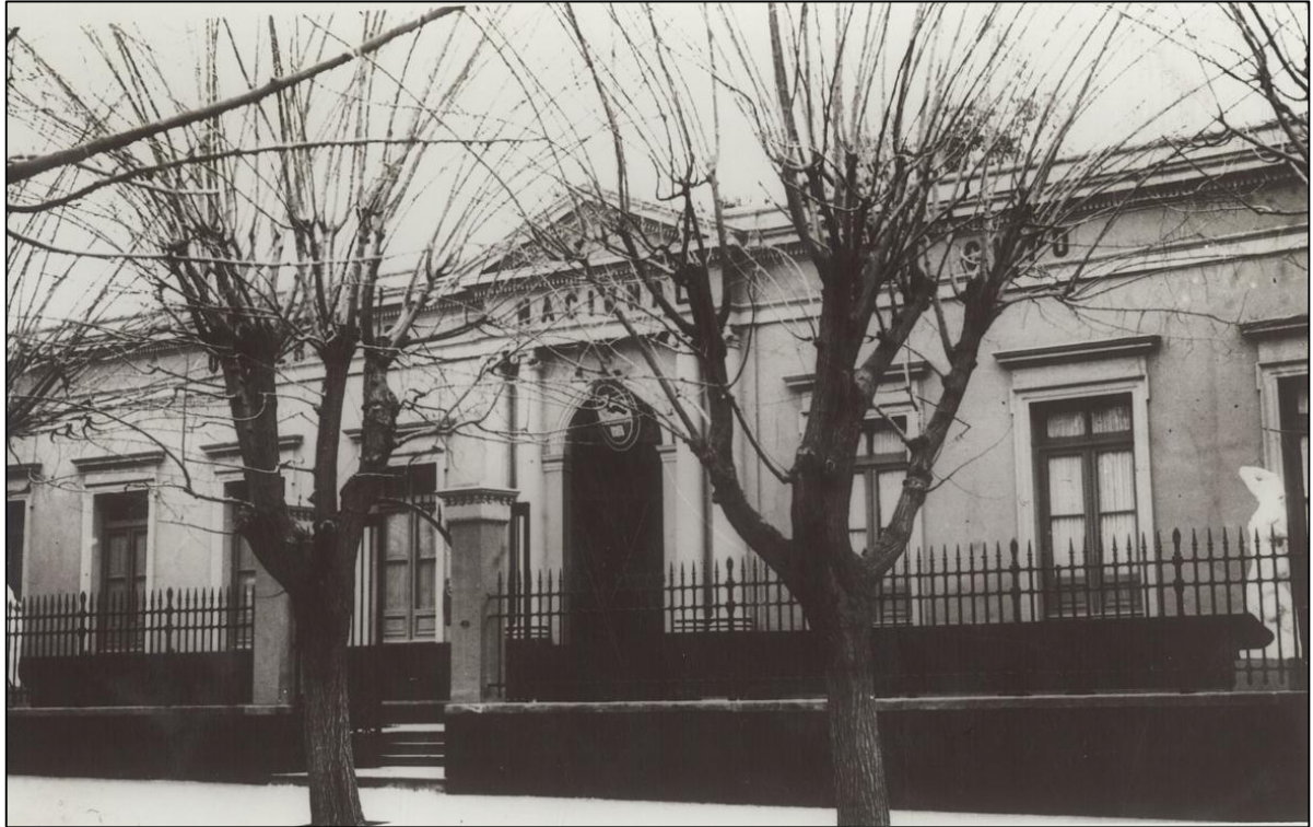
Fachada edificio Universidad Nacional de Cuyo