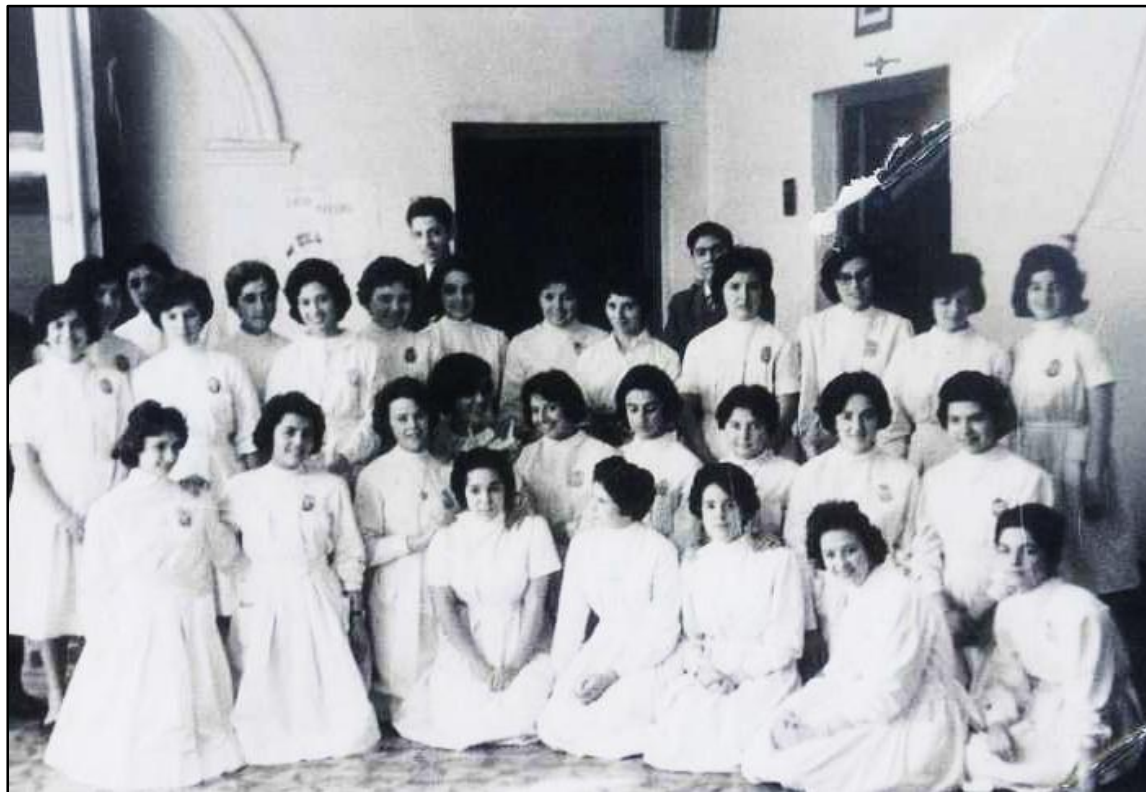
Escuela del Magisterio creada por Ord. N° 252 del 29 de diciembre de 1947