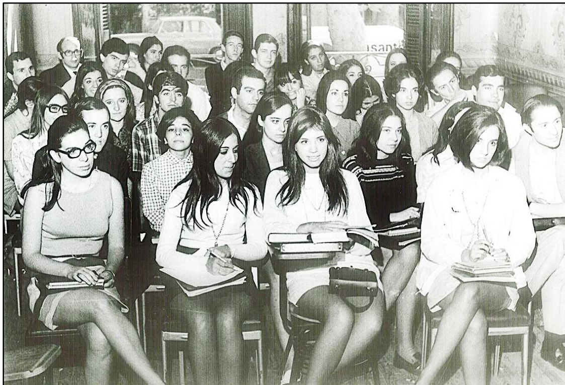
Alumnas Universitarias de la década de los ´70.