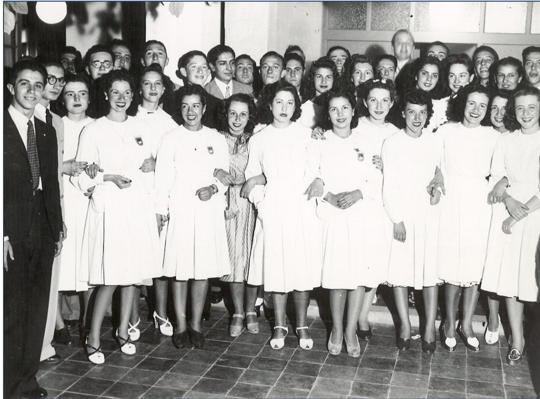
Alumnas de la Universidad