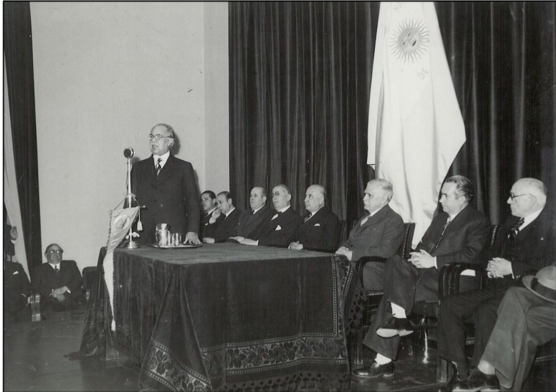
Clase Inaugural dictada por el Dr. Ricardo Rojas, lo acompañan el Vicepresidente de la Nación, Rectores y representantes de Universidades Nacionales además del ex Rector de la Universidad de Buenos Aires.