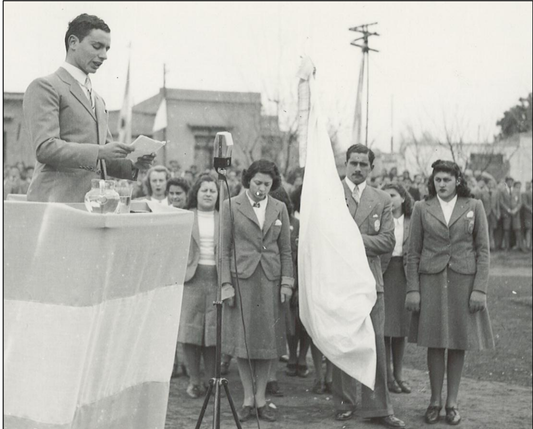
Actos inaugurales U.N.C.