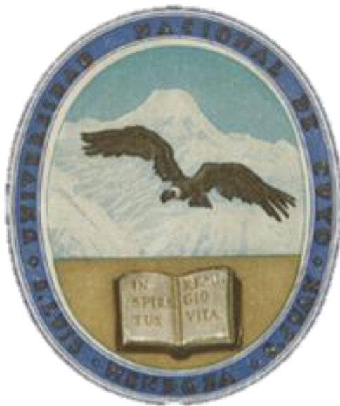
Escudo U.N.C. 1939