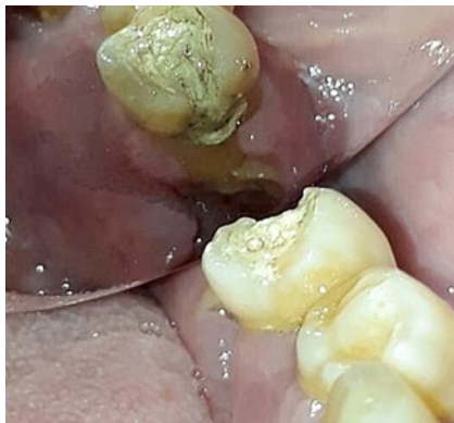
Figura A 2: Vista mesial de alveolo postexodoncia de elemento 36 y apertura de elemento 35.