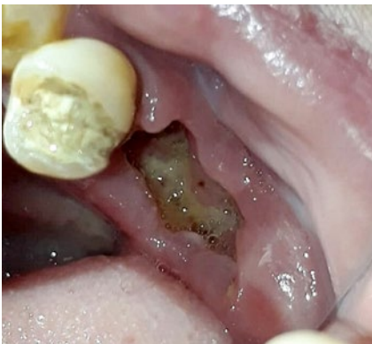
Figura A 1: Alveolo postexodoncia del elemento 36. Se observa exposición de hueso necrótico