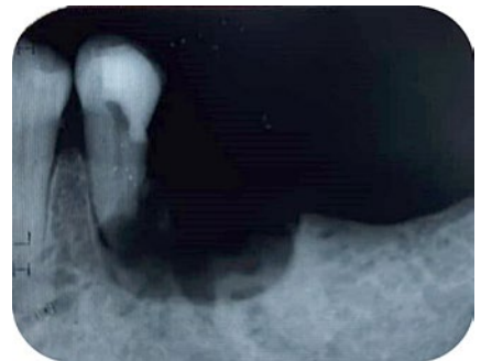
Figura B 1: Imagen radiográfica.

criben múltiples intervenciones realizadas anteriormente por otro profesional que constaron de lavados de lecho, y eliminación de fragmentos óseos con gubia y fresado postexodoncia del elemento 36. Dichas intervenciones se realizaron durante un lapso de aproximadamente 10 meses.