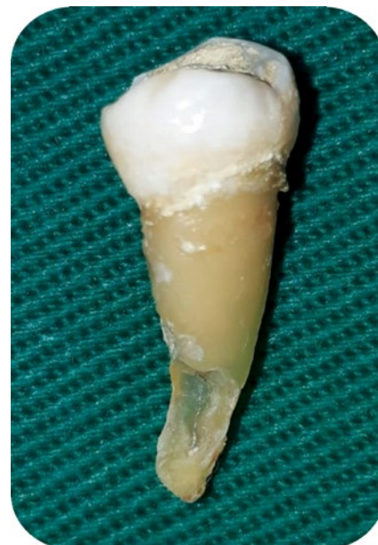
Figura C 2: Elemento 35 postexodoncia. Con evidencia de reabsorción o fresado de tercio apical