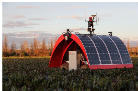
Fig. 6 - Ladybird

Debe hacerse una mención especial a la Universidad de Sidney, la cual ha realizado múltiples proyectos de este tipo, utilizando energía solar y una variada gama de sensores. Ejemplos de algunos de sus proyectos son el Ladybird (Sukkarieh, 2014) y RIPPA ("Rippa robot takes farms forward to the future", 2015)