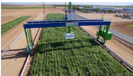
Fig. 2 - La plataforma Field-Scanalyzer analizando un campo de ensayo

Esta es una plataforma fija. Es decir, el campo a ser analizado debe ser sembrado justo debajo de esta, dentro de los parámetros y medidas establecidos. Luego, la plataforma es capaz de obtener diferentes datos agronómicos del cultivo gracias a la variedad de cámaras y sensores que posee.