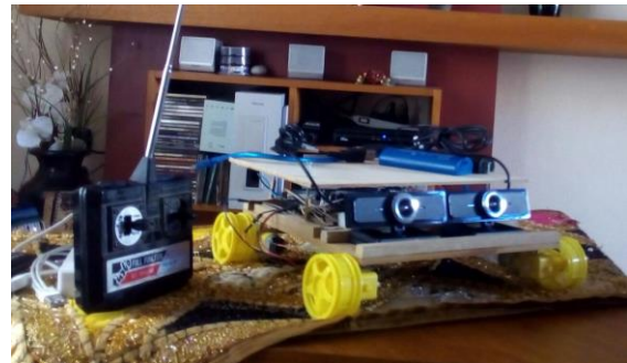
Fig. 9 - Primer prototipo ya finalizado

y se programó para transformar las señales del receptor en movimiento de los motores. También se le incorporó dos cámaras Genius Widecam F100 ("Genius WideCam F100", 2018) de gran angular para las pruebas de visión como puede verse en la Figura 9.