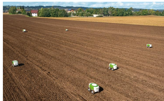
Fig. 3 - Conjunto de robots Mars operando en campo

precisa de maíz con pequeños robots que trabajan en conjunto y comparten los datos recolectados en un medio remoto a través de internet. La navegación por satélite y la gestión de datos mediante internet permiten trabajar las 24 horas del día pudiendo acceder constantemente a todos los datos.