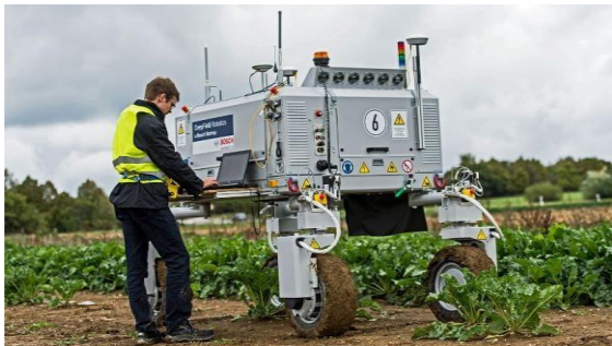
Fig. 1 - Operario controlando la BONIROB V2 de Bosch

Universidad Nacional de Cuyo | Mendoza | Argentina usarlo como guía para el robot) para su navegación autónoma.