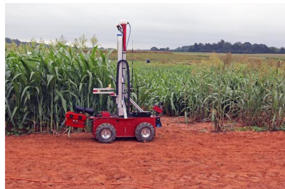
Fig 5 - Robotanist en campo

cuenta con un brazo capaz de tomar medidas de los tallos de sorgo y es capaz de desplegar una amplia gama de sensores de fenotipado incluyendo una cámara estéreo personalizada sincronizada con lámparas de destello de xenón de alta potencia y una cámara de campo de visión de 180° hacia arriba.