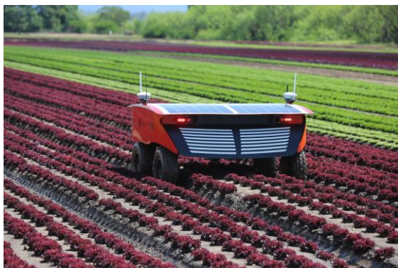
Fig. 7 - RIPPA

La plataforma Ladybird fue diseñada con el propósito de analizar y hacer un modelo 3D de las plantas, almacenando esos datos para después procesarlos con software específico.