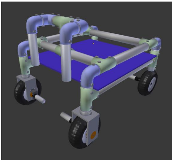
Fig. 11 - Primeros diseños para la plataforma

A la hora de realizar el cálculo de los motores y la reducción que se necesitarían se recurrió a bibliografía de física (Young, Freedman, Flores Flores, & Sears, 2009) □. Luego se encontró una herramienta online llamada Drive Motor Sizing Tool ("Drive Motor Sizing Tool", 2013) del sitio web RobotShop que