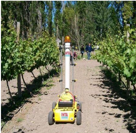
Fig. 4 - Robot de desarrollo nacional en funcionamiento