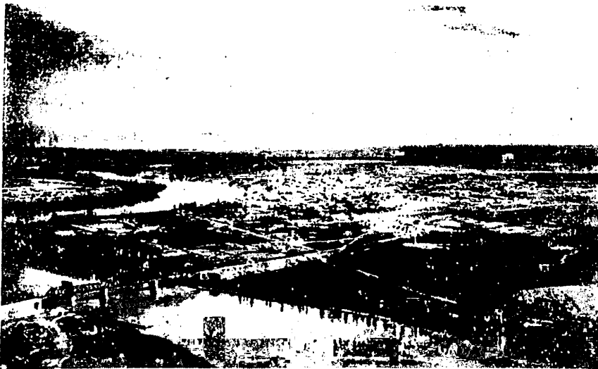
For. 5 - Vista aérea de Viedma (izq.) y Carmen de Patagones (der.) sobre ambas márgenes del río Negro, con sus meandros en el curso inferior.

concluido, aun no se ha habilitado. Proporcionará riego a unas 3.500 hectáreas y se considera la parte de más difícil realización de toda la obra prevista, por los grandes movimientos de tierra que