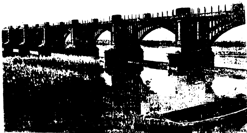
For. 1 - Vista parcial del dique construido en Contralmirante Cordero, sobre el río Neuquén.

cabo. Aceptado el proyecto del ingeniero Cipolletti, de 1899, y previo un informe del ingeniero Decio Severini, profesional que había sido contratado en Italia por Cipolletti, las obras comenzaron bajo la dirección de aquél y con la colaboración de los ingenieros Cambo y Pozzi, el 1 de enero de 1910, con la presencia del Presidente Figueroa Alcorta y numerosa comitiva, entre la cual figuraba el doctor Roque Sáenz Peña, que habría de sucederle meses más tarde en tan alto cargo. Fue un día magnífico. Frente a las brujidas aguas del río Negro, el ministro de Obras Públicas, doctor Ezequiel Ramos Mejía en su discurso comparó la obra con la realizada por los faraones egipcios en el lago Moeris. "El problema del Nilo —dijo— el ministro— era exactamente el problema del río Negro que hoy tratamos de resolver. Aquí, como allá, tenemos un coloso a dominar para que no sean devastados los fértiles valles que recorre entre cerradas curvas, cubriéndolos con su caudal de 9.000 m.c./s. unas veces y para que no haga en otras perecer de sed a los valiosos cultivos de sus orillas con disminución que llega a la ínfima cifra de 250m.c./s. Aquí, como allá, habrán de cambiarse, por la acción del hombre, áridos arenales en vergeles paradisíacos, como hoy mismo podréis verificarlo."