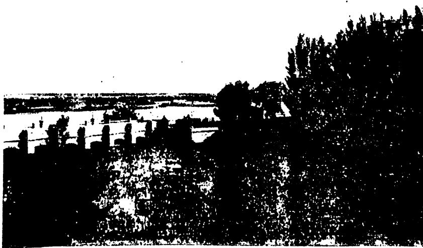
For. 2 - La bocatoma y canal principal derivado del río Neuquén.

Las nuevas obras dieron comienzo inmediatamente. Se construyó el gigantesco dique regulador situado en Contralmirante Cordero sobre el río Neuquén, con un largo total de 420 m. sin contar, naturalmente, las rampas de acceso al puente que miden 160 y 200 m. cada una. Consta el dique de 17 compuertas metálicas que atraviesan el río de margen a margen, pesando cada una alrededor de 33 toneladas y que responden a un sistema eléctrico para controlar y regular a voluntad el pasaje del agua. A cien metros aguas arriba del río y también sobre la margen izquierda se halla la entrada del canal desviador al Lago Pellegrini 9 . Hacia allí se desvía el excedente de agua producido por las grandes crecientes, salvando así de inundaciones peligrosas al valle. Este lago, ex cuenca Vidal, es una depresión del suelo, una enorme olla en forma conoidal, ubicada a unos 30 Km. hacia el noreste de la confluencia de los ríos Limay y Neuquén, cuyo piso en su parte central más profunda está ubicado a 42 m. bajo el nivel del río Neuquén. Su diámetro medio alcanza a 20 m. y sus paredes son barrancas de hasta 100 m. de altura. La superficie es de unos 200 Km 2 . y su capacidad se ha apreciado en unos 8 mil millones de metros cúbicos. Actualmente esa gran olla contiene 800 millones de m 3 . de agua que no se pierden sino exclusivamente por evaporación, ocupando una profundidad de 20 m.