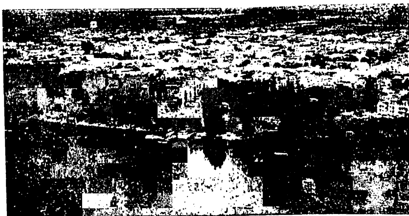
For. 6 - Vista aérea de la capital de Río Negro, Viedma, edificada en el valle inferior a 35 km. de la desembocadura en el Atlántico.

fue necesario ejecutar y que en total alcanzaron a 2.700.000 metros cúbicos. A la altura del Km. 21 del canal principal de este tramo y frente al paraje denominado Monte Bagual, se ha ubicado un sifón nivelador, con un salto de tres metros. Allí se proyecta construir una usina hidroeléctrica.