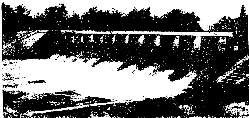
For. 3 - El canal principal a la altura de Cinco Saltos, en el valle superior.

Sobre la misma margen izquierda, se halla la bocatoma del gran canal, que tiene 135 Km. de longitud y va desde el dique hasta Chichinales. En sus primeros 8 Km. posee un ancho de 45 m. por 2 de profundidad; después va disminuyendo a medida que derivan los canales secundarios que alimentan en número de 18 en todo su trayecto. Estos ramales riegan 55.000 hectáreas aproximadamente.